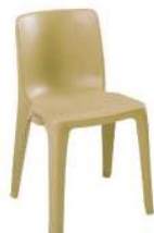
DENVER BEIGE RÉFÉRENCE: 523B