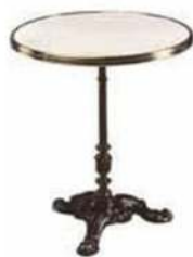
STYLE BISTROT 60 X H 72 CM