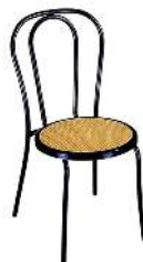
CHAISE BISTROT RÉFÉRENCE: 504