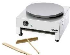
CRÊPIÈRE SIMPLE PLAQUE ÉLECTRIQUE OU GAZ