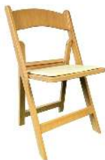
WEDDING EFFET BOIS RÉFÉRENCE: WEDDINGBOIS