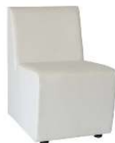
CHAUFFEUSE BLANCHE RÉFÉRENCE: CHAUFFEUSE