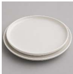
ARTIC D 25CM ET D 19CM