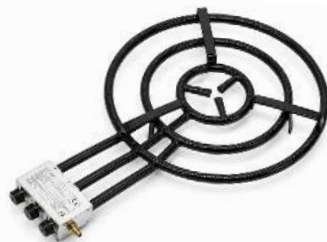
RÉCHAUD PAELLA D 130 POUR 150 À 200 PERSONNES