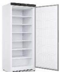
ARMOIRE CONGÉLATEUR 600 L TEMPÉRATURE : -18° / -22°C