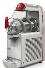
MACHINE A GRANITA CAPACITÉ : 6L