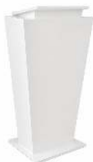
PUPITRE CONFÉRENCE DIMENSION : H 106 X L 53/70 CM