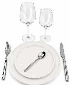
KIT VAISSELLE MODERNE ASSIETTE PLATE ET DESSERT ARTIC FOURCHETTE, COUTEAU ET PETITE CUILLERE LOTUS VERRE 25/31 CL LINEAL