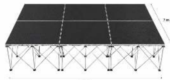
SCÈNE 6 M2 DIMENSION : L 120 X P 70CM