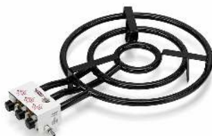
RÉCHAUD PAELLA D 90 POUR 60 À 70 PERSONNES