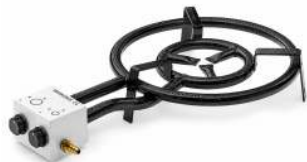
RÉCHAUD PAELLA D 60 POUR 25 À 30 PERSONNES