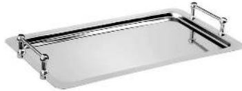
PLATEAU AVEC POGNÉES DIMENSION : 58 X 35.5CM