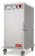
ÉTUVE VENTILÉE TRAITEUR 12 NIVEAUX GASTRO CAPACITÉ : 12 GASTRO