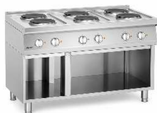
RÉCHAUD 6 FEUX ÉLECTRIQUE DIMENSION : L 120 X P 70CM