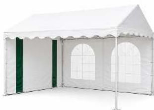
TENTE 3X4 MÈTRES POIDS : 86 KG