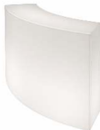
COMPTOIR BAR LUMINEUX DIMENSIONS : L 157CM X L 40CM X H 100CM