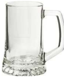
CHOPE À BIÈRE CONTENANCE: 29CL