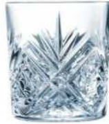
BROADWAY CONTENANCE: 30CL