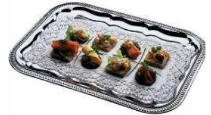
PLATEAU ARRONDI DIMENSION : 32.5 X 53CM