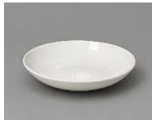
COUSCOUS D 25CM