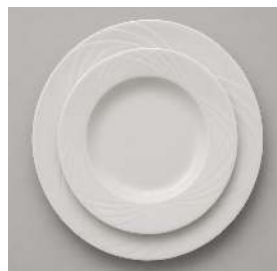
EUROPA PRESENTATION 30CM, PLAT 24CM, DESSERT 20CM, CRÉUSE 21CM