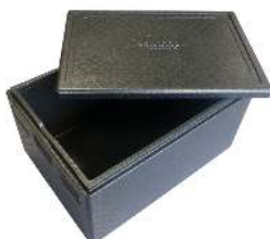
CAISSON ISOTHERME CAPACITÉ : 79L