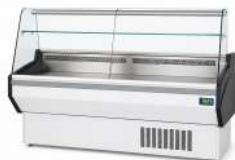
VITRINE 200 CM TEMPÉRATURE : +3° / +6°C