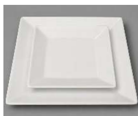
CARRÉE PLATE BLANCHE 26X26 CM, 18X18 CM