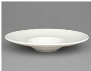
GALICE D 26CM