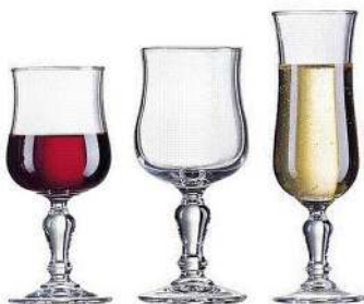
NORMANDIE VIN CONTENANCE: 16.5CL