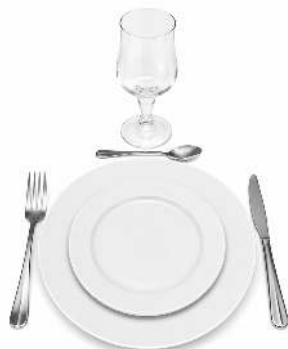
KIT VAISSELLE ECO ASSIETTE PLATE ET DESSERT DÉFI 26,7/18,8CM FOURCHETTE, COUTEAU ET PETITE CUILLERE GRANADA VERRE 24CL NORMANDIE