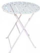
SQUARE PLIANT 60 X H 72 CM