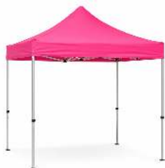
CANOPY PRO ROSE DIMENSION : 3X3M