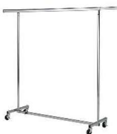
PORTE CINTRES DIMENSIONS RÉGLABLES: L 120/170 X H 110/180 CM