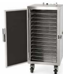
ÉTUVE VENTILÉE COCKTAIL 10 NIVEAUX CAPACITÉ : 10 GRILLES DE 60 X 40CM