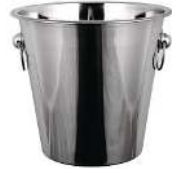
SEAU À CHAMPAGNE CONTENANCE: 8L