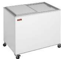
REFROIDISSEUR 300L TEMPÉRATURE : +4° / +10°C