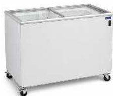
CONGÉLATEUR À GLACE 250 L TEMPÉRATURE : -18° / -25°C