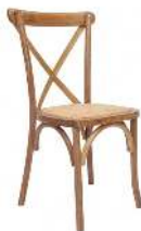
REMY RÉFÉRENCE: REMY