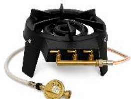
RÉCHAUD TRI PATTES À GAZ DIMENSION : 21.5 X 33 X 42 CM