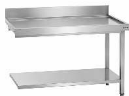
TABLE DE SORTIE MACHINE À CAPOT DIMENSION : 120CM