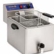
MONOPHASÉ CAPACITÉ : 8L