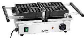
GAUFRIER 1 FER DIMENSION : 525 x 340 x 250 MM