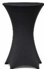
HOUSSE DE MANGE DEBOUT NOIRE DIMENSION : MANGÉ DEBOUT D80