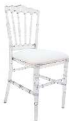
NAPOLÉON TRANSPARENTE RÉFÉRENCE: 507T