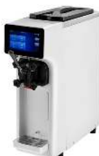
GLACE ITALIENNE 150 PORTIONS / H CAPACITÉ : 20L