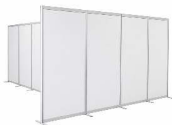
CLOISON BLANCHE DIMENSION : 240 X 100CM