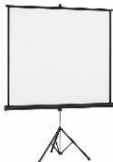
ECRAN DE PROJECTION DIMENSION : 180CM