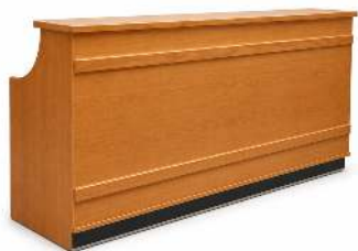
COMPTOIR BAR SEC PLIANT EN BOIS DIMENSION: H 110 X L 250 CM