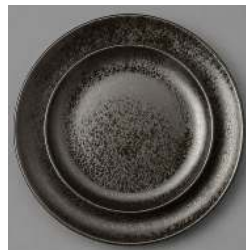
NOIRE SERIE KARBON D 29CM ET 21CM