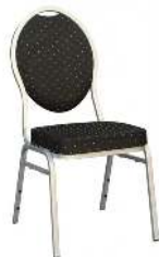
BANQUET CONFORT RÉFÉRENCE: 557