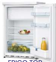
FRIGO TOP CAPACITÉ : 90L