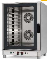
FOUR 10 NIVEAUX AVEC FONCTION VAPEUR DIMENSION : GRILLES 60 X 40CM