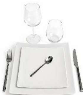
KIT VAISSELLE CARREE ASSIETTE PLATE ET DESSERT CARRÉ 27/21CM FOURCHETTE, COUTEAU ET PETITE CUILLERE LOTUS VERRE 25CL LINEAL GOBELET LIMA