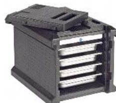
CAISSON ISOTHERME CAPACITÉ : 4 NIVEAUX GASTRO