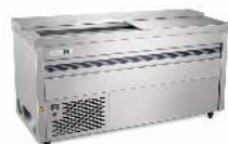
REFROIDISSEUR BOUTEILLE DIMENSION : 200CM X 60CM