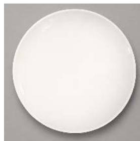
ASSIETTE À STEAK D 27CM