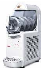
GLACE À L'ITALIENNE MONO PARFUM CAPACITÉ : 6L