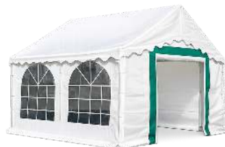
TENTE 5X4 MÈTRES POIDS : 126 KG