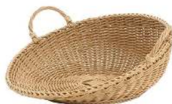
CORBEILLE À ANCHOIADE DIMENSION : 55 X 50CM