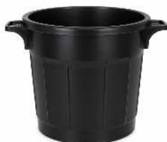
LAITIÈRE CAPACITÉ : 75L