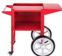
CHARENTE POUR MACHINE POP CORN MATÉRIAUX : ACIER