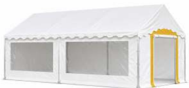
TENTE 5X8 MÈTRES POIDS : 203 KG