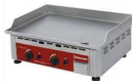
PLANCHA À GAZ DIMENSION : 55.5 X 40CM