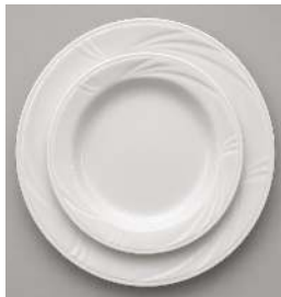
NEPTUNE D 25CM ET D 19CM