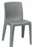
DENVER ANTRACITE RÉFÉRENCE: 523