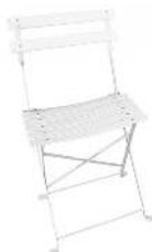
SQUARE BLANCHE RÉFÉRENCE: SQUARE