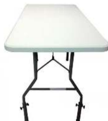
RÉCHAUSSES DE TABLE RÉHAUSSE UNE TABLE DE 74 CM À 95 CM