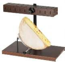
RACLETTE TRADITIONNELLE CAPACITÉ : 1/2 MEULE