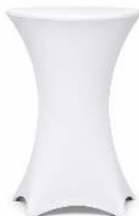
HOUSSE DE MANGE DEBOUT BLANCHE DIMENSION : MANGÉ DEBOUT D80