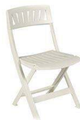
FLORIS RÉFÉRENCE: 508