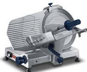
TRANCHEUSE A JAMBON LAME PROFESSIONNELLE Ø 300 MM