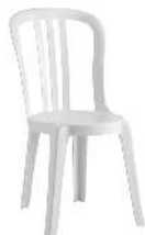
MIAMI EMPILABLE RÉFÉRENCE: 500