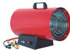
CANON AIR CHAUD GAZ / 220 V UTILISATION EN ZONES VENTILÉES OBLIGATOIRE