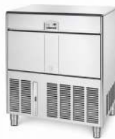
MACHINE GLAÇON 90KG PRODUCTION : 90 KG / 24 H