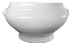
SOUPIÈRE TÊTE DE LION CONTENANCE : 280CL