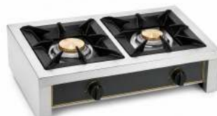
RÉCHAUD 2 FEUX GAZ PUISSANCE : 12KW