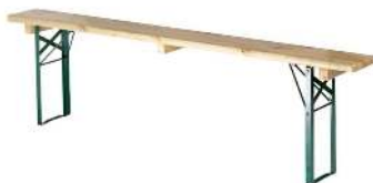
BANC BOIS RÉFÉRENCE: 506