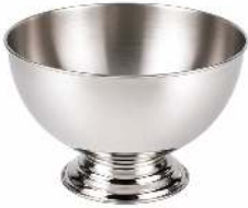
VASQUE CONTENANCE: 12L, 16L