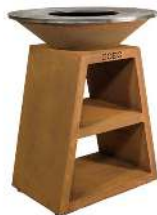
BRAZERO PLANCHA DIMENSION : 98CM