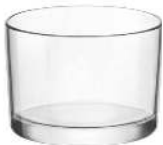
VERRE BODEGA CONTENANCE: 21.5CL