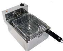
MONOPHASÉ CAPACITÉ : 4L