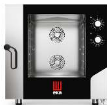
FOUR EKA 6 NIVEAUX AIR PULSÉ DIMENSION : GRILLES 60 X 40CM