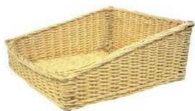
CORBEILLE EN OSIER GRAND MODÈLE DIMENSION : 52 X 50CM