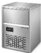
MACHINE GLAÇON 35 KG PRODUCTION : 35 KG / 24 H