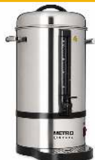
PERCOLATEUR CAPACITÉ : 5L