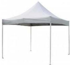
CANOPY DIMENSION : 3X3M