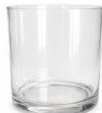
WHISKY RÉUTILISABLE CONTENANCE: 4CL