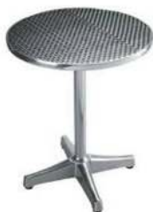
ALLUMINIUM 60 X H 72 CM