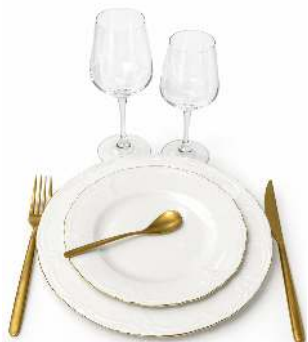
KIT VAISSELLE RETRO ASSIETTE PLATE ET DESSERT RETRO BORD DORE FOURCHETTE, COUTEAU ET PETITE CUILLERE DORES CANADA GOLD VERRE 25/31 CL LINEAL