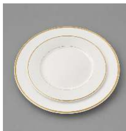
FILET OR 27CM ET 21CM