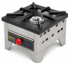
RÉCHAUD MAMOUTH À GAZ DIMENSION : 44.5 X 47.5 X 35 CM