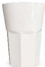
VERRE À MOJITO PLASTIQUE CONTENANCE: 29CL