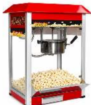
MACHINE À POP CORN PRODUCTION : 5 KG/H