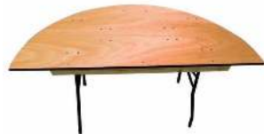
TABLE DEMI-ROND 200 X 90 X H 76 CM