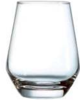
GOBELET LIMA CONTENANCE: 38CL