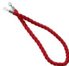
CORDON 2MÈTRES MATÉRIAUX : CORDE / ACIER