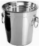
SEAU À GLAÇONS CONTENANCE: 1.4L