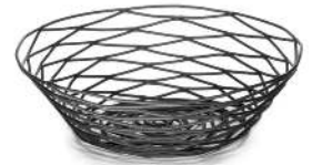
PANIÈRE MÉTA NOIR ISIS DIMENSION : 20CM