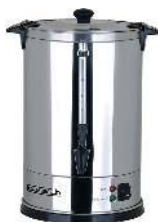
PERCOLATEUR CAPACITÉ : 10L