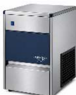
MACHINE GLAÇON 60KG PRODUCTION : 60 KG / 24 H