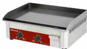
PLANCHA ÉLECTRIQUE DIMENSION : 60 X 40CM