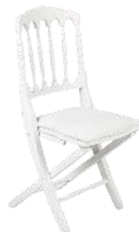
NAPOLÉON BLANCHE RÉFÉRENCE: 507