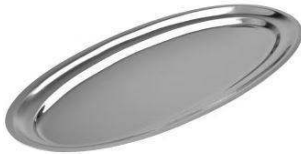
TORPILLEUR DIMENSION : 60CM