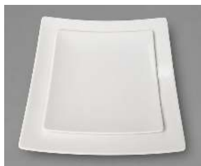
CARRÉE 27X27 CM, 21X21 CM