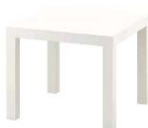
LACK 52 X 52 X H 45 CM