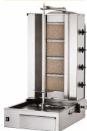
BROCHE KEBAB CAPACITÉ : 40KG