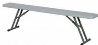
BANC POLYÉTHYLÈNE RÉFÉRENCE: 506C