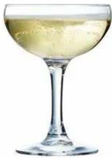
COUPE À CHAMPAGNE CONTENANCE: 16CL