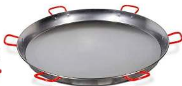
PLAT À PAELLA D 130 POUR 150 À 200 PERSONNES