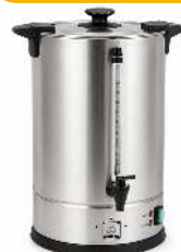
PERCOLATEUR CAPACITÉ : 15L