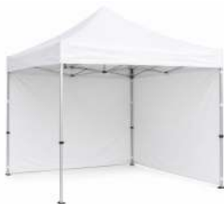
CANOPY PRO BLANC DIMENSION : 3X3M