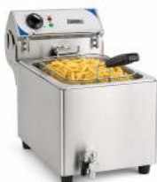
MONOPHASÉ CAPACITÉ : 10L