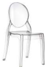
MÉDAILLON RÉFÉRENCE: 576