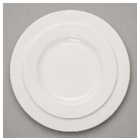
DEFI PRESENTATION 32CM, PLAT 26CM, DESSERT 21CM