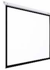
ECRAN DE PROJECTION MURAL DIMENSION : 200 X 240CM