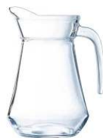
BROC CONTENANCE : 1L