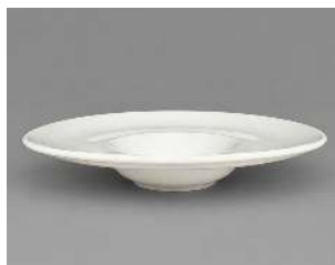
ROMA D 22CM