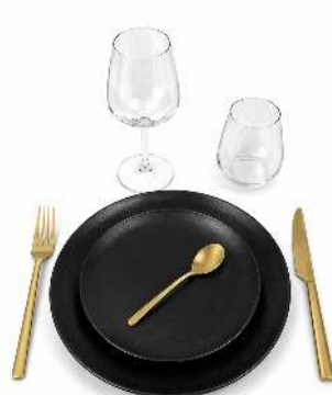
KIT VAISSELLE BLACK & GOLD ASSIETTE PLATE ET DESSERT KARBONE FOURCHETTE, COUTEAU ET PETITE CUILLERE CANADA GOLD VERRE 25CL LINEAL GOBELET LIMA