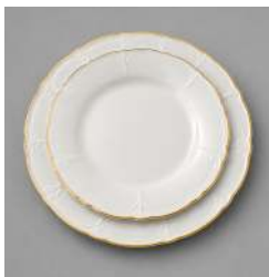
RÉTRO BORD DORÉ PLAT 27,5CM, DESSERT 21CM, CRÉUSE 23,5CM