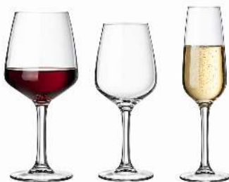
LINEAL VIN CONTENANCE: 25CL