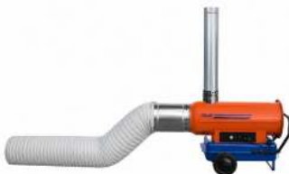
CANON CHALEUR FIOUL RÉSERVOIR : 100 L