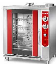
FOUR 6 NIVEAUX AIR PULSE PATISSIER DIMENSION : GRILLES 60 X 40CM