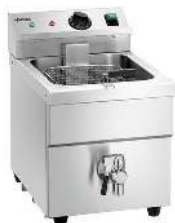
INDUCTION CAPACITÉ : 8L