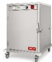
ÉTUVE VENTILÉE 12 NIVEAUX DOUBLE GASTRO CAPACITÉ : 24 GASTRO