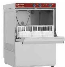
LAVE VERRES CAPACITÉ : 7L