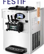
GLACE ITALIENNE 2 PARFUMS + MIX CAPACITÉ : 6L X 2