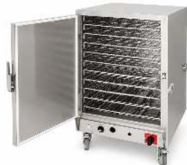
ÉTUVE GAZ MIXTE 10 NIVEAUX PÂTISSIER CAPACITÉ : 10 GRILLES DE 60 X 40CM