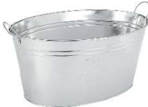
BASSINE ZINC CONTENANCE: 24L