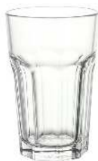
VERRE À MOJITO CONTENANCE: 16CL