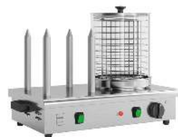
HOT DOGGER CAPACITÉ : 120 HOT-DOGS / H