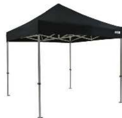
CANOPY PRO NOIR DIMENSION : 3X3M