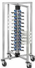
ECHELLE PORTE ASSIETTES CAPACITÉ : 48 ASSIETTES