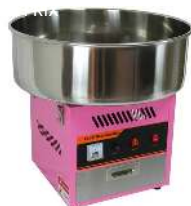
APPAREIL POUR BARBE À PAPA DIMENSION CUVE : 50D