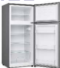
RÉFRIGÉRATEUR MÉNAGER CONTENANCE : 120L