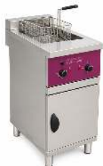
TRIPHASÉ CAPACITÉ : 16L