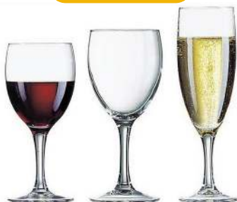
ÉLÉANCE VIN CONTENANCE: 14.5CL