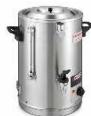
LAITIÈRE CAPACITÉ : 5L