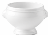
SOUPIÈRE TÊTE DE LION CONTENANCE : 40CL