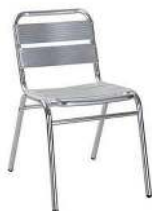
CHAISE ALLUMINIUM RÉFÉRENCE: 505C