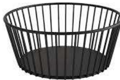
CORBEILLE METAL NOIR DIMENSION : 20CM