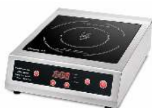
PLAQUE INDUCTION 3500W DIMENSION : L 34.3 × P 44.3 × H 12.5 CM CAPACITÉ : 10 GRILLES DE 60 X 40CM