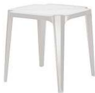
TABLE BASSE-HAUTE 70 X 70 X H 71 CM