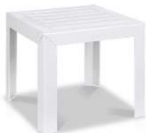
MIAMI 40 X 40 X H 35 CM